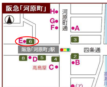
6番出口 Eのりば 206系統 「熊野神社前」下車歩5分