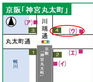
4番出口 ウのりば 204系統 「熊野神社前」下車歩5分