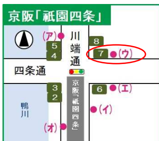
7番出口 ウのりば 201・203系統 「熊野神社前」下車歩5分